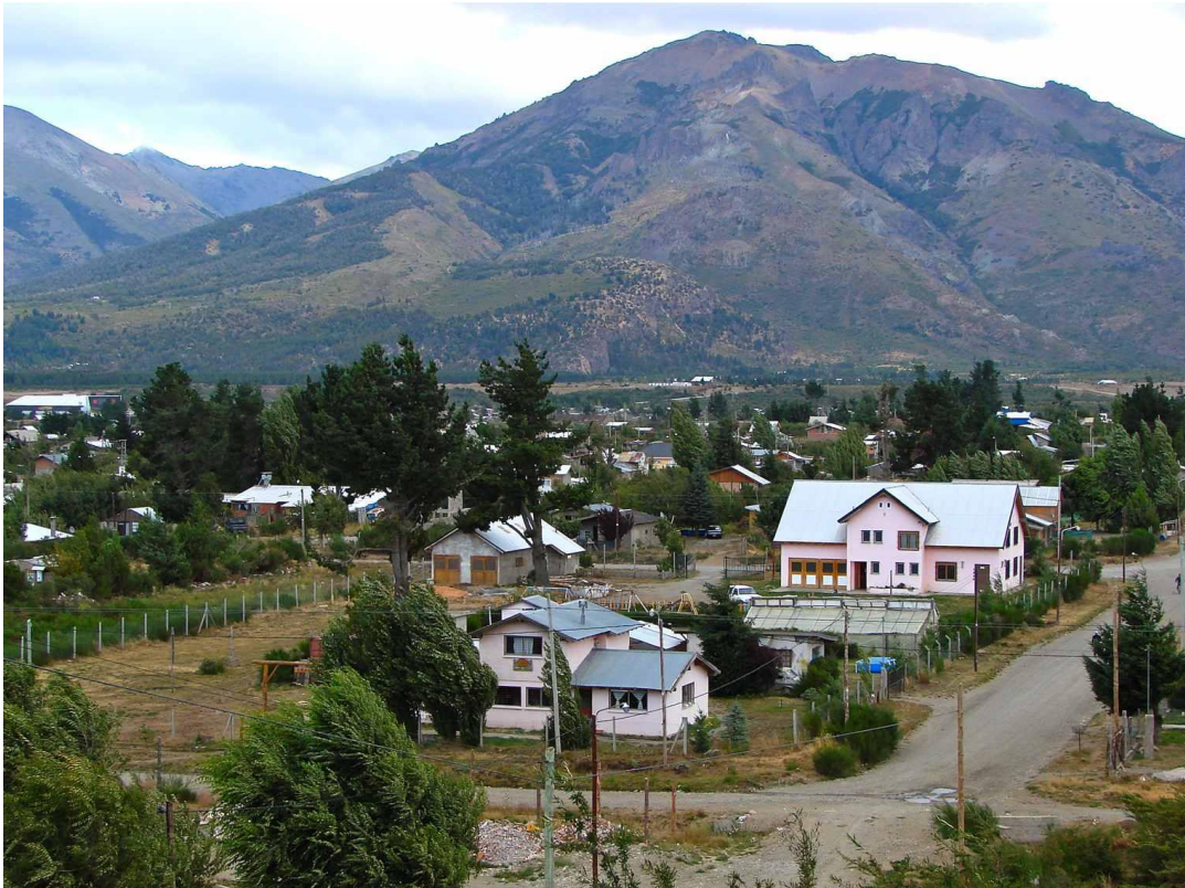
Il centro Esperanza nella visione d'insieme 2001 con (da sotto verso l'alto): Centro giornaliero con le diverse case (in parte nascoste), la serra, l'officina e in alto a sinistra la falegnameria costruita nel 2003

Nel 2003 a causa dell' aumento della polvere e del rumore nell'edificio laboratorio abbiamo deciso di costruire un edificio aggiuntivo per la falegnameria . La vecchia falegnameria è diventata una sala polivalente.