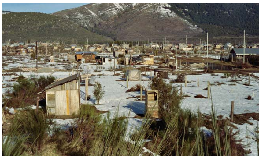
Quartier proche de notre Centre Esperanza

Il fait presque toujours froid. En hiver la température descend facilement jusqu'à 10-15 degrés au-dessous de zéro et le vent souffle sans pitié. La période estivale est courte. En décembre et janvier il peut faire chaud, mais rarement au-dessus de 28°. Au mois de mars commencent déjà les premières gelées et de toute façon la pluie. Le centre ville de Bariloche est attrayant avec ses beaux hôtels et magasins. Les riches se sont installés en se faisant construire des magnifiques villas. Tout semble montrer richesse et beauté. Malheureusement à peine 400 mètres en dehors du centre de la ville, commence l'autre façade de Bariloche, celle des pauvres.