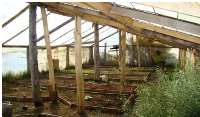
La serre avec ses différents légumes

En automne 1997, avec l'aide de ADRA Allemagne on a pu construire une serre pour que les enfants puissent cultiver avec joie les légumes nécessaires pour la cuisine.