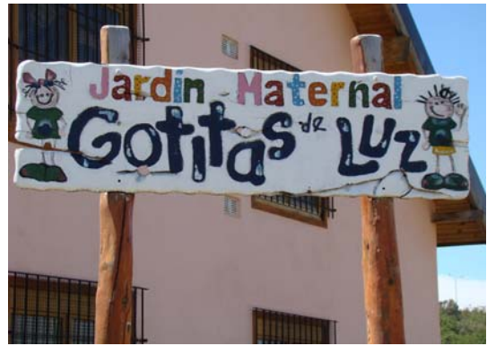
Le nom donné par les parents à l'école maternelle: "Gouttes de Lumières"