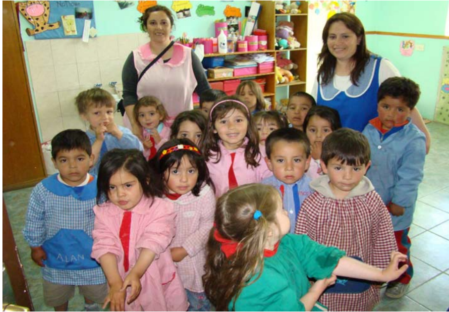
Un groupe d'enfants de l'école maternelle, avec leurs éducatrices

Ça a donné un temps de travail très intense. Dans les ateliers il y avait 60 adolescents et adolescentes. L'école maternelle, d'une capacité d'accueil normale de 50-70 enfants, en avait plus de 80, plus 6 orphelins et celles qui leur faisait de maman et plus d'autres hôtes particuliers.