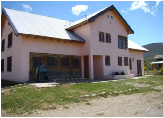
L'établissement principal, siège de l'école maternelle