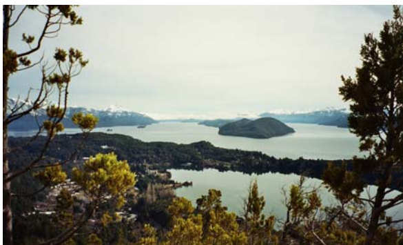
Le lac Nahuel Huapi

Bariloche est une ville de 80'000 habitants, à 1'700 km au sud de Buenos Aires, fondée par des Suisses et des Allemands située dans la Patagonie centrale aux bords d'un côté de la chaîne andine et de l'autre du magnifique lac Nahuel Huapi.