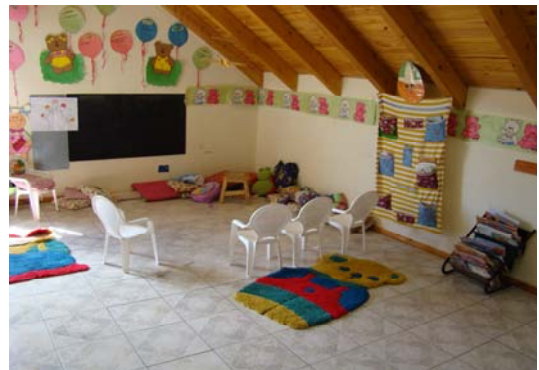
Un des espaces de l'école maternelle