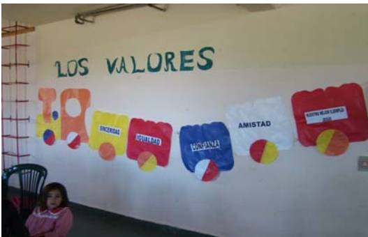
Les valeurs enseignées: Sincérité, Parité, Confiance, Amitié, notre meilleur exemple Jésus