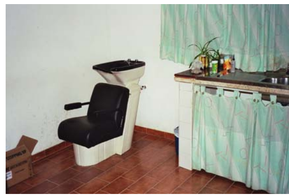
L'atelier de coiffure

Ces opportunités de formation professionnelle furent un grand succès. On organisa deux fois par an une exposition des produits, avec même des défilés de mode en invitant les médias à y être présents. On s'est fait ainsi connaître dans toute la ville comme une bonne et sérieuse école professionnelle.