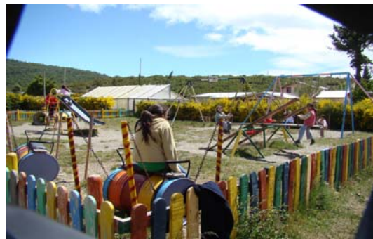
Le parc de jeux

Le 2001 fut une année noire pour l'Argentine et sa monnaie. La pauvreté est plus proche que jamais et les besoins d'aide se multiplièrent. Ainsi l'école maternelle passa de 18 à 40 enfants, dont beaucoup très mal nourris et malades. La salle à manger accueillit plus de 70 enfants affamés qui cherchaient aussi de l'affection et de la sécurité.. Ce qui sembla au début une catastrophe se démontra par la suite une bénédiction. La dévaluation du Pesos a permis de développer les relations commerciales avec l'étranger, les produits agricoles ont eu de débouchés intéressants. Bariloche a eu un nouveau développement grâce aux touristes étrangers ce qui a permis de donner du travail à beaucoup de gens. Ainsi un souffle d'air frais et d'espoir arriva dans le pays. Après dix ans sans possibilités de travail, bien de femmes trouvèrent la possibilité de gagner quelque chose, mais elles ne pouvaient pas se permettre de confier leurs enfants dans une école maternelle du centre ville. L'école maternelle du Centre Esperanza, l'unique du quartier de El Frutillar, à 7 km du centre, se trouva d'un coup envahi de 80 petits enfants, 30 le matin et les autres l'après-midi, certains même tout les jours. Les éducatrices cherchèrent quelque chose de spécial pour donner à ces enfants l'éducation de meilleure qualité et la renommée de l'école se propagea dans toute la région.