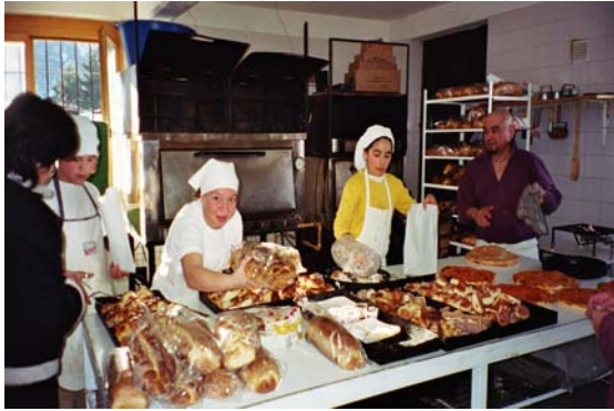
L'atelier de boulangerie