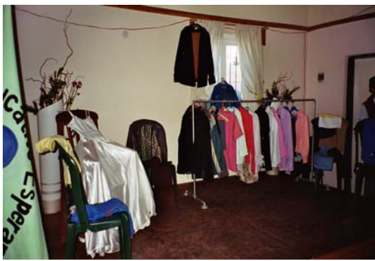
Des produits de l'atelier de couture

En 2002, grâce à ADRA Allemagne, on créa aussi les ateliers de couture et de coiffure. L'engagement était limité à 3 ans, mais en faisant très attention aux dépenses on a réussi à prolonger d'ultérieurs 2 ans l'activité de ces deux ateliers.