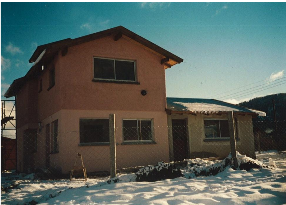
La maison terminée en août 1997

Un terrain idéal fut trouvé en plein slums du quartier „El Frutillar“ et dès fin 1996 les travaux commencèrent. La première maison comprenait une grande salle à manger et une cuisine ainsi que les installations sanitaires. Au premier étage, un petit appartement pour la prise en charge future d'orphelins sociaux fut aménagé.